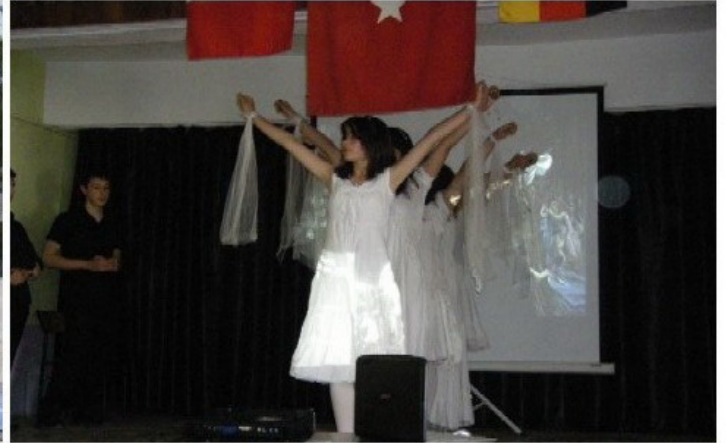
Türkische Schüler inszenieren den "Erlkönig": hier der Tanz der Elfen