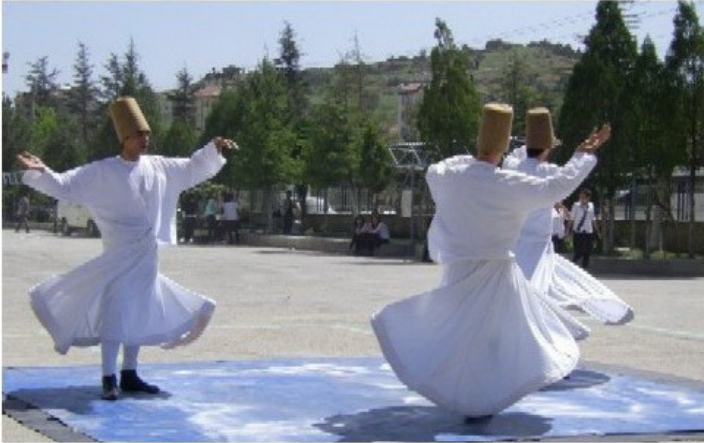
Frühlingsfest: Tanz der drei Derwische